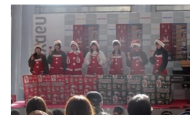
クリスマスイベント