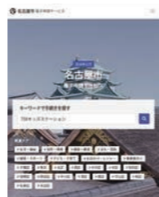
名古屋市電子申請サービス トップページ