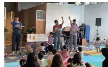
おやこdeびよカフェコンサート

公園に出掛け、季節を感じながら外遊びをする「そとへいこう!」、ピアノの演奏や読み聞かせ、手遊び等でゆったりと過ごす「おやこdeびよカフェコンサート」、ナディアパークのアトリウムで実施するクリスマスイベントなど。詳細はキッズステーション公式SNSでお知らせします。是非ご参加ください。