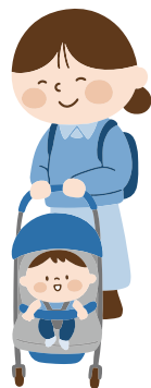
クリスマス イベント

キッズステーションでは親子で楽しめるイベントを多数開催しています。キッズパーク内では「キッズパークミニイベント」として、お子さんを遊ばせながら保育園の入園について保育案内人さんに相談できたり、図書館の司書さんによる絵本の読み聞かせ会や、やさしい抱っこのミニ講座などを実施したりしています。気候のいい季節には、「そとへいこう!」を開催し、近くの公園などで親子で外遊びを楽しんでいます。また、年に数回、キッズステーションのマルチルームや、ナディアパークのアトリウムに特設ステージを設置して行う大きなイベントも実施しています。イベントの様子や開催日時等はキッズステーションHP、SNSでお知らせしていますので、是非チェックしてくださいね!