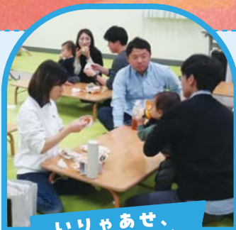
いりゃあせ、 758 ランチ会