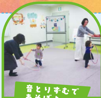
音とりすむで あそぼ♪