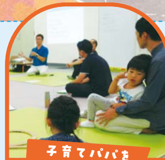
子育てパパを つなぐ場