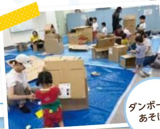
ダンボールで あそぼう